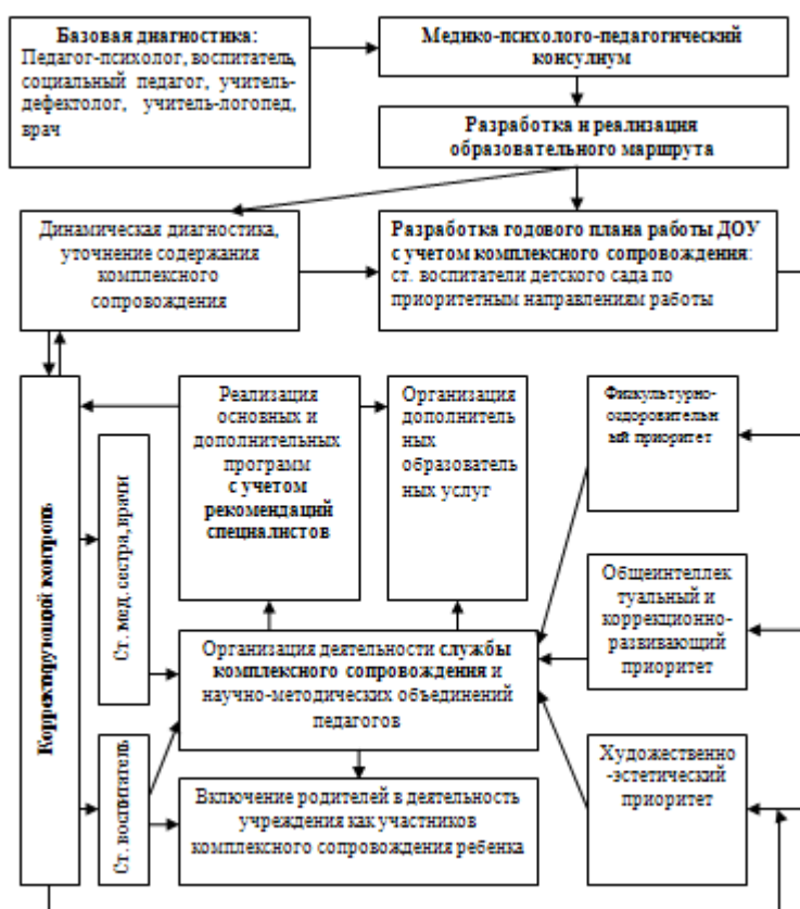
Схема взаимодействия специалистов

Работой по образовательной области « Речевое развитие » руководит учитель-логопед, а другие специалисты подключаются к работе и планируют образовательную деятельность в соответствии с рекомендациями учителя-логопеда.